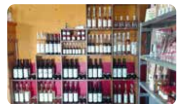
Domein Hof te Dieren, wijngaard

Dan is het tijd om verder te reizen naar Dieren. Domein Hof te Dieren is de grootste ommuurde wijngaard van Nederland. Niet onbelangrijk is dat ze er heerlijke wijnen en likeuren maken! De wijnboer ontvangt u op hartelijke wijze en geeft uitleg in de wijngaard. Er is een proeverij met drie wijnen en/of likeuren, met als thema: 'lekker, leuk, leerzaam en ludiek'. Daarbij wordt versgebakken stokbrood met kruidenboter geserveerd. We sluiten af met de gelegenheid om in de winkel nog iets lekkers voor thuis mee te nemen. Op de terugweg maken we een stop voor een heerlijk driegangendiner om de dag gezellig af te sluiten.