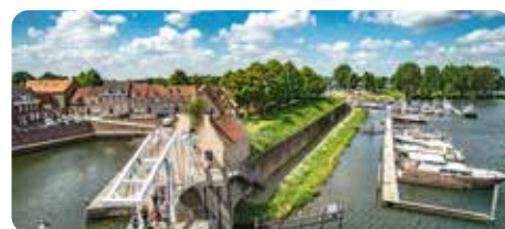
RBT De Langstraat - bezoekdelangstraat.nl

Halverwege de middag leggen we weer aan in Heusden. Dit eeuwenoude vestingstadje is met haar vestingwerken, gezellige straatjes, historische panden, diverse ateliers en galerieën, knusse boetiekjes, stijlvolle toprestaurants en uitstekend uitgeruste havens een fantastische bestemming voor iedereen die van Brabantse gezelligheid en gastvrijheid houdt. U gaat een korte highlightwandeling maken onder leiding van een gids, waarbij u langs enkele markante, interessante en mooie punten van de vesting zult gaan. Daarna is er nog voldoende tijd om op eigen gelegenheid door Heusden te struinen. Of misschien pakt u liever een lekker terrasje, dat is helemaal aan u! Indien gewenst kan de dag worden afgesloten met een diner op de terugreis.