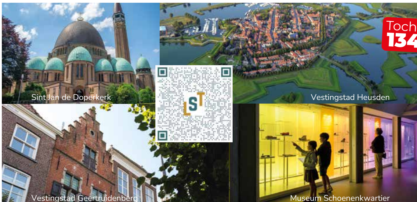
Sint Jan de Doperkerk