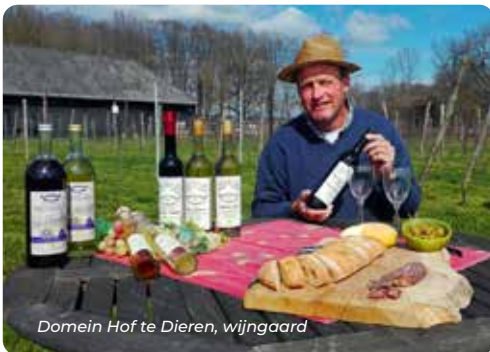
Domein Hof te Dieren, wijngaard